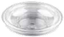
2 TAPADERA PLÁSTICO