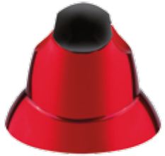
1 PULSADOR PUESTA EN MARCHA