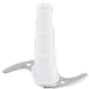
4 2ª CUCHILLA INOX TRITURAR