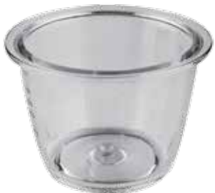
5 RECIPIENTE CRISTAL 1,2L.